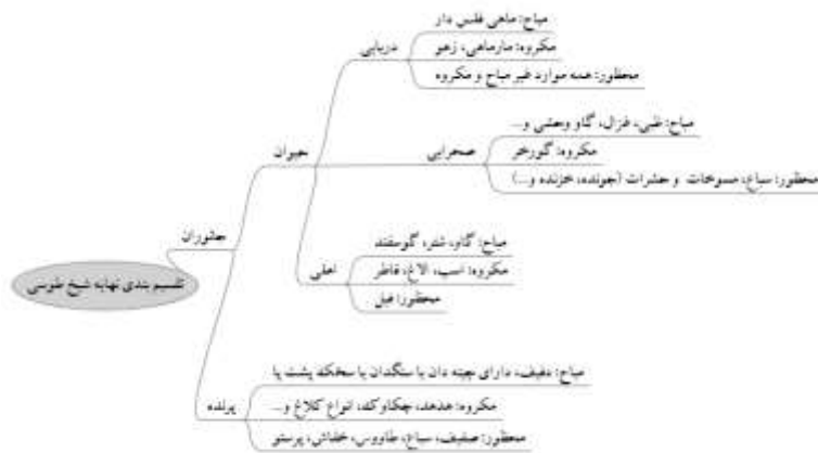
تصویر شماره ۲: طوسی، ۱۴۰۰: ۵۷۸-۵۷۴

پس از وی و در دوره‌های بعد هرچند فقهای چینی چون محقق حلی (محقق، ۱۴۰۸ ق، ج ۳: ۱۷۴-۱۶۹) تقسیم‌بندی‌های متفاوت‌تری ارائه نموده‌اند، اما حرمت خوردن حشرات اعم از جوندگان، خزندگان، بندپایان و غیره کماکان به قوت خود باقی ماند و تنها حلیت ملخ از آن مستثنا شد. در فقه حنفی نیز همانند فقه امامیه خوردن همه حشرات حرام و تنها ملخ حلال شمرده شده است. (الکاسانی، ۱۹۸۶ م، ج ۵: ۳۶؛ ابن مازہ، ۲۰۰۴ م، ج ۶: ۵۷؛ سرخسی، ۱۹۹۳ م، ج ۱۱: ۲۲۰)